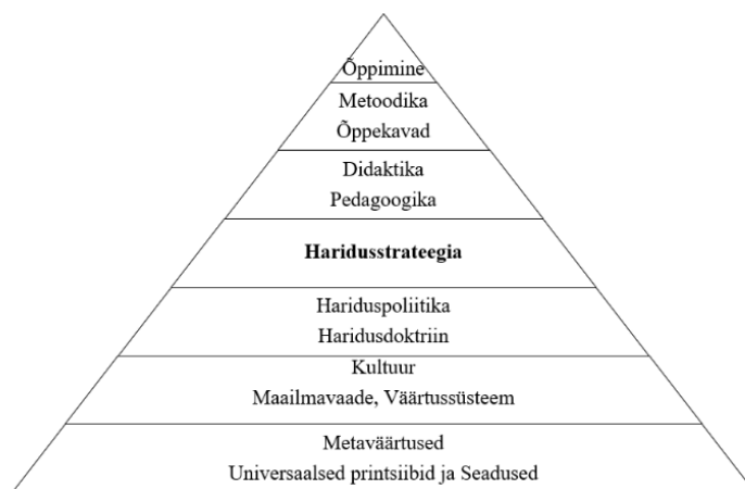
Joonis 1. Haridusstrateegia