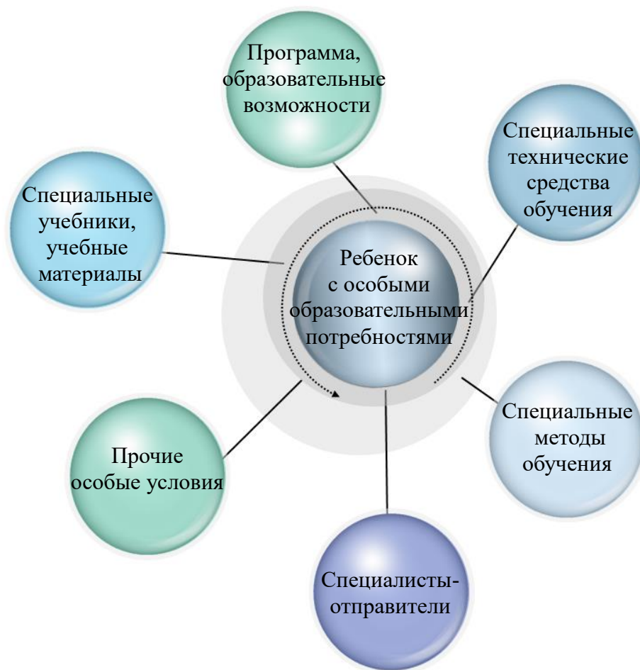
Схема. Специальные образовательные условия

III ступень – количество учащихся ROK, LOK, TOK