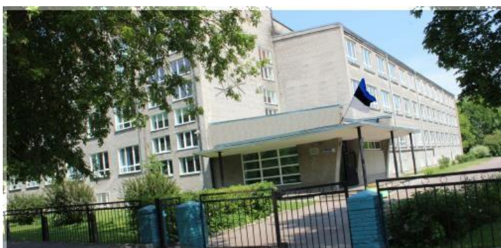
Фото 2. Маардуская основная школа